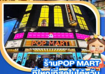
ร้านPOP MART ที่ใหญ่ที่สุดในโลกไต้หวัน