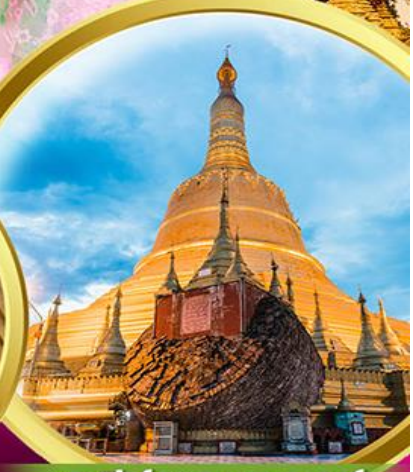
เจดีย์ชเวดากอง

พิเศษ!! กุ้งแม่น้ำเผาท่านละ 1 ตัว + บุฟเฟ่ต์HOTPOT