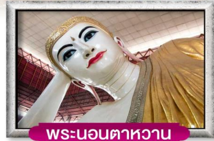
พระนอนตาหวาน