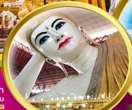
พระนอนตาหวาน