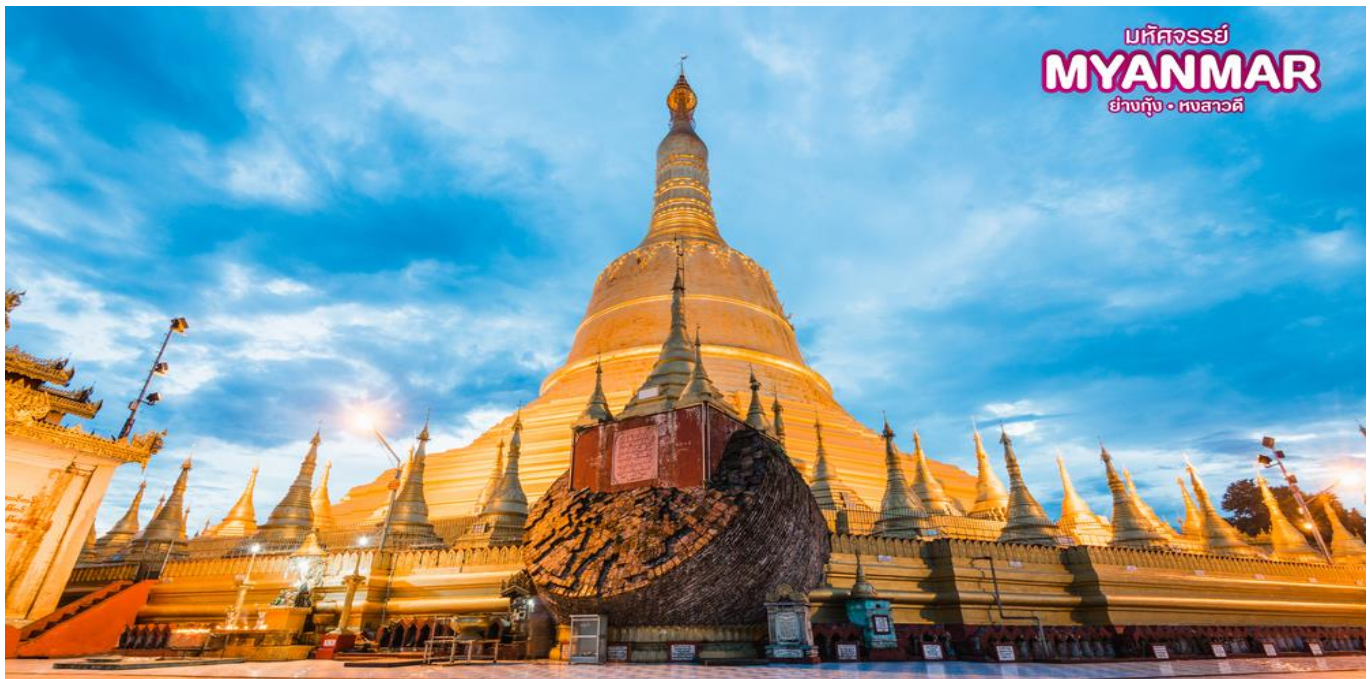
มหัศจรรย์ MYANMAR ย่างกุ้ง • หงสาวดี

เจดีย์เก่าแก่คู่บ้านคู่เมืองและเป็น 1 ใน 5 มหา บูชาสถานสิ่งศักดิ์สิทธิ์ของพม่า ซึ่งเจดีย์นี้ สมเด็จพระนเรศวรมหาราช ของไทย เคยมาสักการะ เป็นศิลปะที่ผสมผสานระหว่างศิลปะพม่าและศิลปะของมอญได้อย่างกลมกลืน มีจุดอธิษฐานที่ศักดิ์สิทธิ์อยู่ตรงบริเวณยอดฉัตรที่ตกลงมาเมื่อปี พ.ศ. 2473 ด้วยน้ำหนักที่มหาศาล ตกลงมายังพื้นล่างแต่ยอดฉัตร กลับยังคงสภาพเดิมและไม่เคยกระจัดหายไปเป็นที่รำลึกถึงความศักดิ์สิทธิ์โดยแท้ แม้สกาล ณ จุดอธิษฐานอันศักดิ์สิทธิ์ และสามารถนำรูปไปกำกับยอดของเจดีย์องค์ที่หักลงมาเพื่อเป็นสิริมงคล ซึ่งเปรียบเหมือนตั้งคำจูนชีวิตให้เจริญรุ่งเรืองยิ่งขึ้นไป