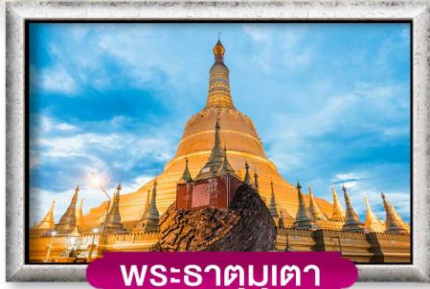
พระธาตุมูตา