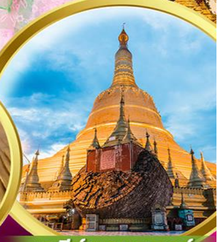
เจดีย์ชเวดากอง

พิเศษ!! กุ้งแม่น้ำเผาท่านละ 1 ตัว + บุฟเฟ่ต์HOTPOT