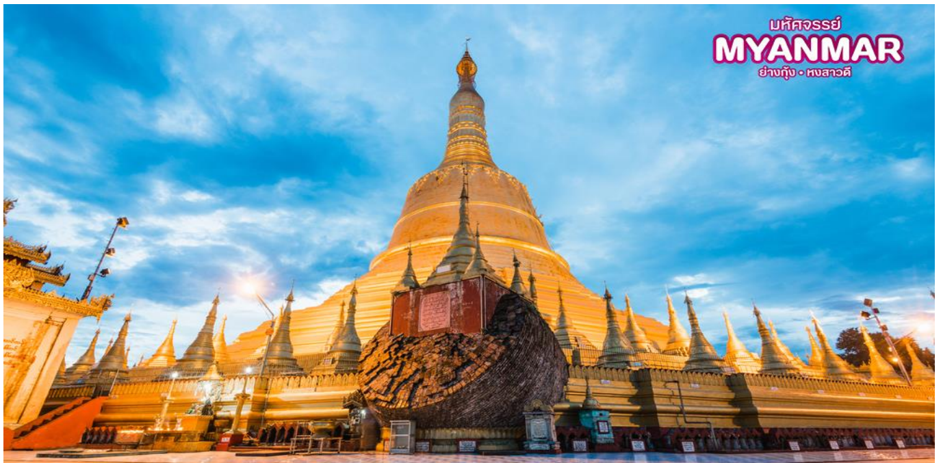
มหัศจรรย์ MYANMAR ย่างกุ้ง • หงสาวดี

เจดีย์เก่าแก่คู่บ้านคู่เมืองและเป็น 1 ใน 5 มหา บูชาสถานสิ่งศักดิ์สิทธิ์ของพม่า ซึ่งเจดีย์นี้ สมเด็จพระนเรศวรมหาราช ของไทย เคยมาสักการะ เป็นศิลปะที่ผสมผสานระหว่างศิลปะพม่าและศิลปะของมอญได้อย่างกลมกลืน มีจุดอธิษฐานที่ศักดิ์สิทธิ์อยู่ตรงบริเวณยอดฉัตรที่ตกลงมาเมื่อปี พ.ศ. 2473 ด้วยน้ำหนักที่มหาศาล ตกลงมายังพื้นล่างแต่ยอดฉัตร กลับยังคงสภาพเดิมและไม่แตกกระจายออกไปเป็นที่รำลึกถึงความศักดิ์สิทธิ์โดยแท้ แม้สกาล ณ จุดอธิษฐานอันศักดิ์สิทธิ์ และสามารถนำรูปไปค้ากับยอดของเจดีย์องค์ที่หักลงมาเพื่อเป็นสิริมงคล ซึ่งเปรียบเหมือนดั่งคำจูนชีวิตให้เจริญรุ่งเรืองยิ่งขึ้นไป