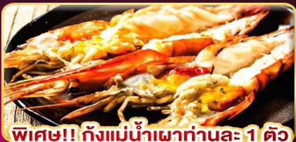
พิเศษ!! กุ้งแม่น้ำเผาท่านละ 1 ตัว