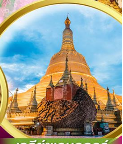
เจดีย์ชเวดากอง

พิเศษ!! กุ้งแม่น้ำเผาทำนละ 1 ตัว + บุฟเฟ่ต์HOTPOT