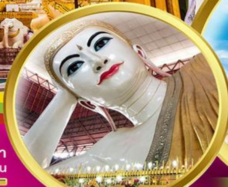
พระนอนตาทวน