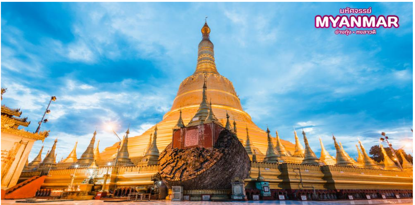
มหัศจรรย์ MYANMAR ย่างกุ้ง • หงสาวดี

เจดีย์เก่าแก่คู่บ้านคู่เมืองและเป็น 1 ใน 5 มหา บูชาสถานสิ่งศักดิ์สิทธิ์ของพม่า ซึ่งเจดีย์นี้ สมเด็จพระนเรศวรมหาราช ของไทย เคยมาสักการะ เป็นศิลปะที่ผสมผสานระหว่างศิลปะพม่าและศิลปะของมอญได้อย่างกลมกลืน มีจุดอธิษฐานที่ศักดิ์สิทธิ์อยู่ตรงบริเวณยอดฉัตรที่ตกลงมาเมื่อปี พ.ศ. 2473 ด้วยน้ำหนักที่มหาศาล ตกลงมายังพื้นล่างแต่ยอดฉัตร กลับยังคงสภาพเดิมและไม่แตกกระจายออกไปเป็นที่รำลึกถึงความศักดิ์สิทธิ์โดยแท้ นมัสการ ณ จุดอธิษฐานอันศักดิ์สิทธิ์ และสามารถนำรูปไปค้ากับยอดของเจดีย์องค์ที่หักลงมาเพื่อเป็นสิริมงคล ซึ่งเปรียบเหมือนถั่งค้ำจุนชีวิตให้เจริญรุ่งเรืองยิ่งขึ้นไป