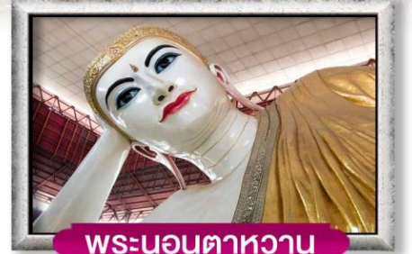
พระนอนตาหวาน