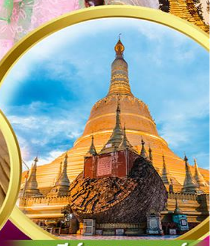
เจดีย์ชเวมอดอร์

พิเศษ!! กุ้งแม่น้ำเผาท่านละ 1 ตัว + บุฟเฟ่ต์HOTPOT