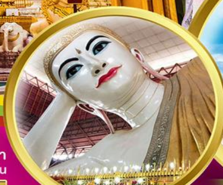
พระนอนตาหวาน