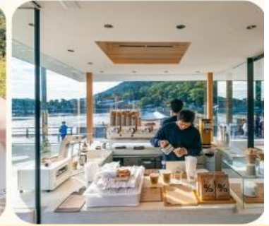
กลางวัน รับประทาน อาหารกลางวัน ณ ร้านอาหารญี่ปุ่น

วัดคินคะคุจิ (Kinkakuji Temple) เป็นวัดสี่เหลี่ยมทองอร่ามตั้งโดดเด่นเป็นสง่า และที่สำคัญวัดคินคะคุจิ ก็ไปปรากฏอยู่ในการ์ตูนเรื่อง เณรน้อยเจ้าปัญญา “อิคคิวซัง” หรือมีอีกชื่อก็คือ วัดทอง (Golden Pavilion) และมีชื่อที่เป็นทางการคือ วัดโรคุออนจิ (Rokuonji Temple) สร้างขึ้นในปี 1397 ตั้งอยู่ในเมืองเกียวโต เป็นวัดพุทธนิกายเซ็น สำนักรินไซ เป็นแหล่งท่องเที่ยวที่นิยมอย่างมากทั้งชาวญี่ปุ่นเองและชาวต่างชาติ