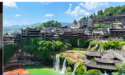
เมืองโบราณผู่หงเจี้ยน