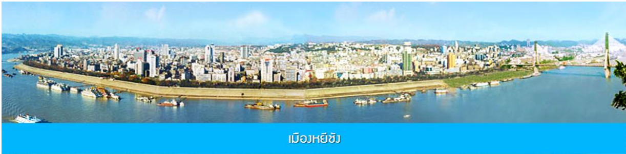
เมืองหยี่ชาง