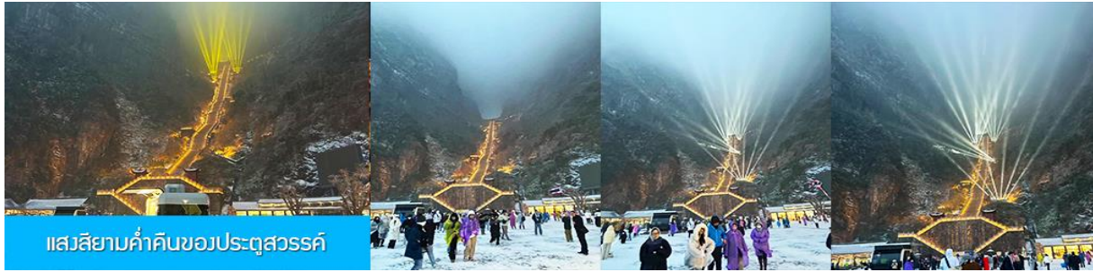
แสงสยามคำคืบของประดู่สวรรค์

บันไดเลื่อนรวมอยู่ในทัวร์แล้ว 999 ขึ้น ณ ลานกว้างด้านล่างเป็นจุดถ่ายรูปที่ดีที่สุดที่สามารถมองเห็นเขาประดู่สวรรค์ได้อย่างชัดเจน