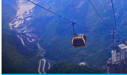
กระเช้าขึ้นเขเทียนเหมินซาน

https://hk.trip.com/hotels/guzhang-hotel-detail-68614854/chaxitai-holiday-hotel/