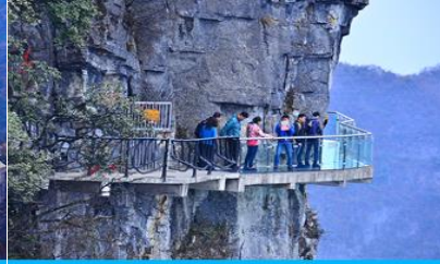
หน้าผาลอยฟ้าทางเดินกระจก