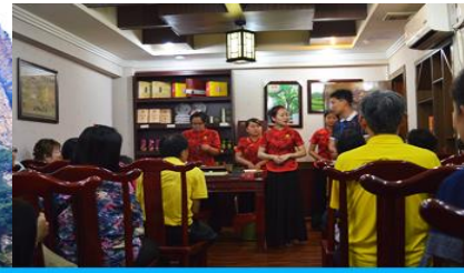
ร้านใบชา