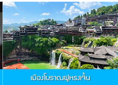
เมืองโบราณผู่หงเจี้ยน