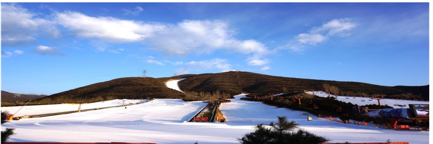
GO1CNXPEK-CA008 บนตรงเขียงเหม..ฉลองบเหม ณ มหานครปักกิ่ง กำแพงเมืองจีน ดานจวหยกวน SKI 5วน 3 คน (CA) เมล่งราน

จากนั้นนำท่านเดินทางสู่ ลานสกี Jundushan Ski Resort เป็นลานสกีที่อยู่ใกล้ เมืองปักกิ่งห่างจากตัวเมืองประมาณ 40 กิโลเมตร ตั้งอยู่บริเวณภูเขาในเมืองฉางผิง ภายในรีสอร์ตมีพื้นที่สำหรับเล่นสกี 150,000 ตารางเมตร ลานสกีต่างๆ (สำหรับผู้เริ่มต้น ชั้นรอง และชั้นสูง) จึงมีความยาวรวมกว่า 4,000 เมตร (รวมค่าอุปกรณ์และเล่นได้ 2 ชั่วโมง )