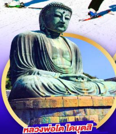
หลวงพ่อโต โดบุตสึ