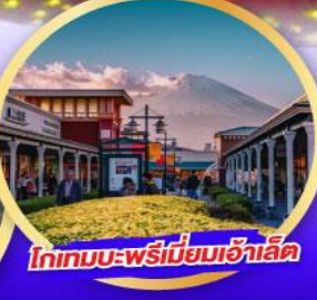
โทเทมบะพรีเมียมเอ้าลิต

เดินทาง 14-19 ม.ค. 68 21-26 ม.ค. 68 28 ม.ค.-02 ก.พ. 68