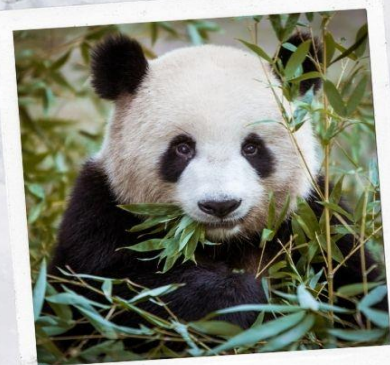
ศูนย์อนุรักษ์หมีแพนดำ