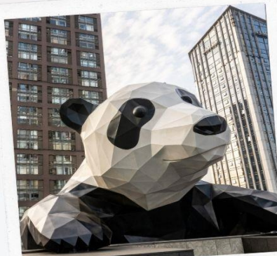
ถนนชุนซีลู่