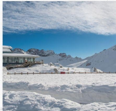
ภูเขาหิมะการ์เซียต้ากู่ปิงชวน