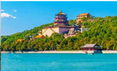
พระราชวังฤดูร้อนหยี่เหอหยวน