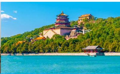
พระราชวังฤดูร้อนหยี่เหอหยวน