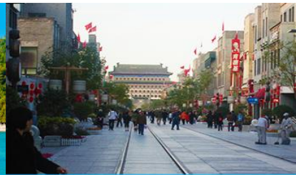
ถนนเทียนเหมิน