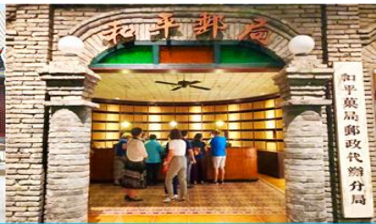
เมืองโบราณจำลอง