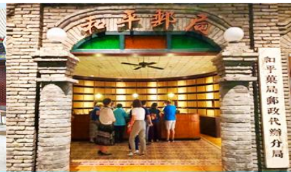
เมืองโบราณจำลอง