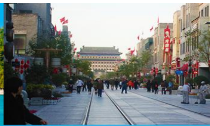
ถนนเทียนเหมิน