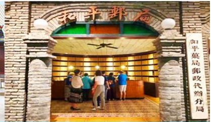
เมืองโบราณจำลอง