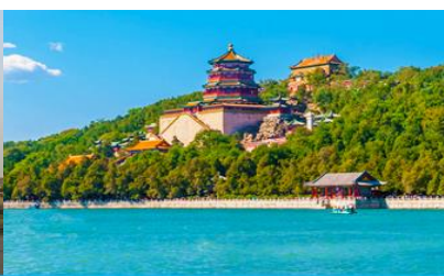
พระราชวังฤดูร้อนหยี่เหอหยวน