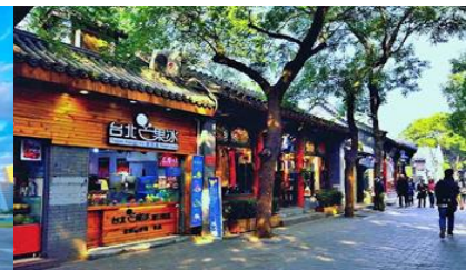
ชอยหนานหลิวกู่เซี่ยง