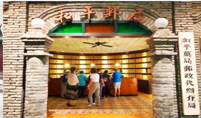
เมืองโบราณจำลอง