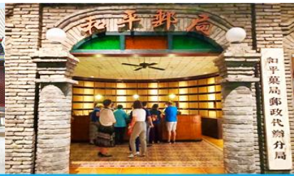
เมืองโบราณจำลอง