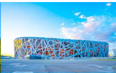
สนามกีฬาโอลิมปิก