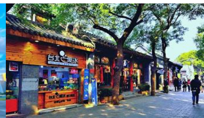
ชอยหนานหลิวคู่เซี่ยง