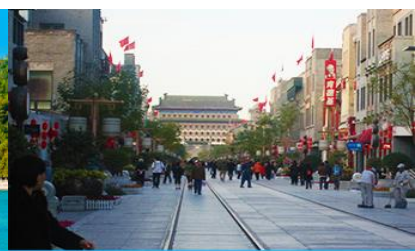
ถนนเจียนเหมิน