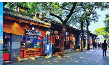
ซอยหนานหลัวกู่เซียง