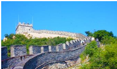
กำแพงเมืองจีนด่านฉวิยงกวน

พักที่ JINGLIN HTL OR HOLIDAY INN EXPRESS HTL 4* หรือ โรงแรมในระดับเดียวกันในกรุงปักกิ่ง