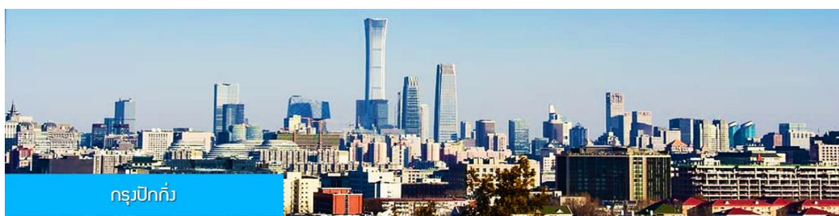
กรุงปักกิ่ง