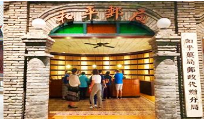
เมืองโบราณจำลอง