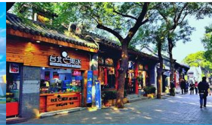
ชอยหนานหลัวกู่เซียง