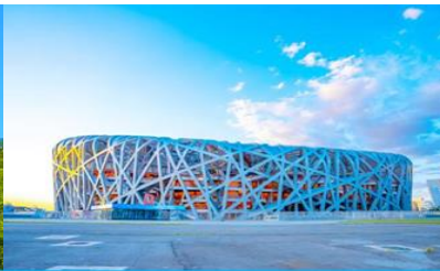
สนามกีฬาโอลิมปิก