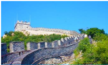
กำแพงเมืองจีนด่านฉวิยงกวน

พักที่ JINGLIN HTL OR HOLIDAY INN EXPRESS HTL 4* หรือ โรงแรมในระดับเดียวกันในกรุงปักกิ่ง