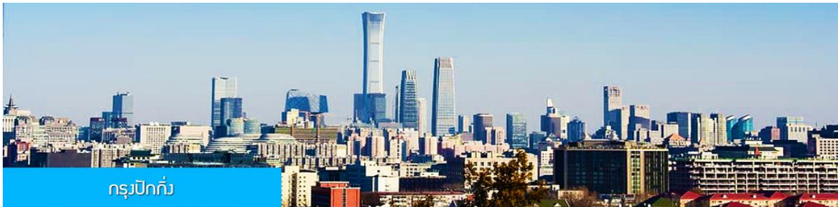
กรุงปักกิ่ง

วันแรก ทำอากาศยานสุวรรณภูมิ – กรุงปักกิ่ง