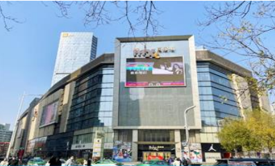
ห้าง วานเซียงเว็