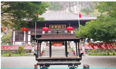
วัดซีเสี่ย

นำท่านเที่ยวชม สวนเจ็ดดาว 七星公园 เป็นสาธารณะที่ใหญ่ที่สุดและสวยงามที่สุดในเมืองกุ้ยหลิน ตั้งอยู่ทางด้านตะวันออกของแม่น้ำหลีเจียงมีชื่อเสียงในเรื่อง ภูเขาเขียว น้ำสวย ถ้ำแปลก และหินงาม ภายในอุทยานมีอาณาเขตครอบคลุมพื้นที่เนินเขา 7 ลูก ที่เรียงกันเหมือนกลุ่มดาวหมีใหญ่ ภายในมีสถาปัตยกรรมจีนโบราณตั้งเรียงรายและพืชพันธุ์มากมายในท่านได้เพลินเพลิดเพลินกับหุบเขาอันเจียบสงบ ชมความสวยงามของ ถ้ำเจ็ดดาว 七星岩 ที่ภายในเต็มไปด้วยหินงอกหินย้อยและเสาหินที่เกิดจากการหลอมละลายของหินปูน นำท่านชม เขาอูฐ 骆驼山 ภูเขารูปร่างคล้ายหลังอูฐนี้เกิดจากการดันตัวของเปลือกโลก เดิมเรียกว่าเขาจอกสุรา แต่เดิมในอดีตนั้นสถานที่แห่งนี้เคยเป็นที่ปลุกวิเวกของเหล่านักปราชญ์ แล้วเขาอูฐนี้ก็ได้อกลายเป็น สัญลักษณ์ทางภูมิทัศน์ของกุ้ยหลินอีกด้วย นำท่านชม วัดซีเสี่ย 栖霞寺 ซึ่งตั้งชื่อโดยพระภิกษุชื่อดัง ถานเถียน แห่งราชวงศ์ซุ่ย วัดนี้สร้างขึ้นในสมัย ราชวงศ์ถัง มีระเบียบทางเดินคดเคี้ยว และสระบัวสีขาว โรงเจ ลานเจ้าอาวาส. ศาลา ดิงเยว่ พระพุทธรูปศิลปะราชวงศ์ ถังอันงดงาม งานแกะสลักไม้ตงหยางอันล้ำค่าและเจ้าแม่กวนอิมหินอ่อนสีขาวอันงดงาม