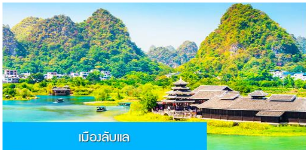
เมืองลับแล

หลังอาหารเช้าท่านเดินทางกลับเมืองกุ้ยหลิน ระหว่างเดินทางไกด์จะนำเสนอ OPTIONAL TOUR หรือ โปรแกรมทัวร์เสริมที่ไม่ได้รวมอยู่ในรายการทัวร์