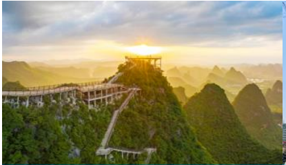
ภูเขาหลุย่ฟง

พักที่ YANG SHUO KEYCARD HOTEL ระดับ 4 ดาวท้องถิ่นหรือเทียบเท่าใน เมืองหยางชั๋ว