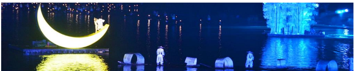
The Impression of Liu Shan Jie

หลังอาหารนำท่านเดินทางเข้าที่พัก ใกล้เคียงจะนำเสนอ OPTIONAL TOUR หรือโปรแกรมทัวร์เสริมที่ไม่ได้รวมอยู่ในรายการทัวร์ โดยท่านสามารถเลือกซื้อโปรแกรมทัวร์เสริมด้วยความสมัครใจ เป็นบัตรชมการ