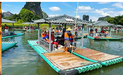
ขึ้นเรือแพชมแม่น้ำหลิวเจียง