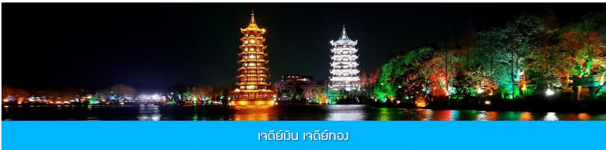
เจดีย์มื่น เจดีย์ทอง