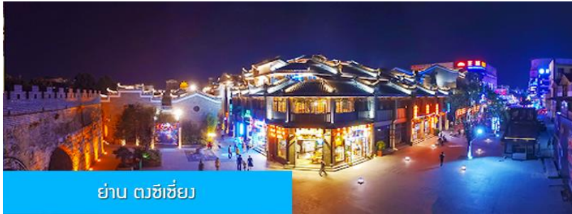
ย่าน ทีวีซีเยว