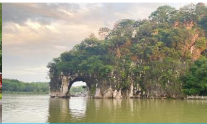
เขางวงช้าง