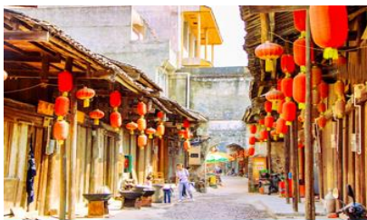
เมืองโบราณต้าชวี

พักที่ GUILIN VIENNA HOTEL โรงแรมระดับ 4 ดาวท้องถิ่น หรือเทียบเท่าในเมืองกุ้ยหลิน