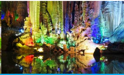
ถ้ำเจ็ดดาว