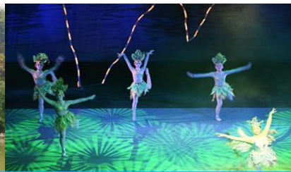
โชว์ DREAM LIKE LIJIANG