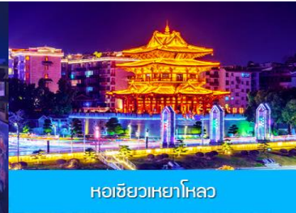
หอชิวเวหาโหลว