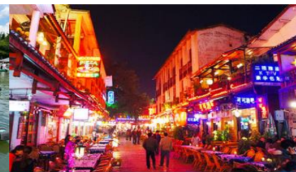
ถนนคนเดิน ชีเจียหรือถนนเฟร็ง