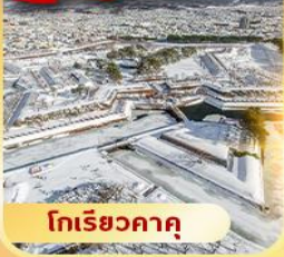
โทริเยวคาคุ