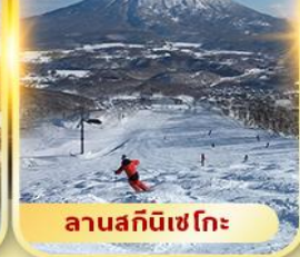
ลานสกีนิเซโกะ