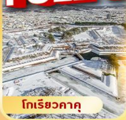
โทริยิวคาคุ