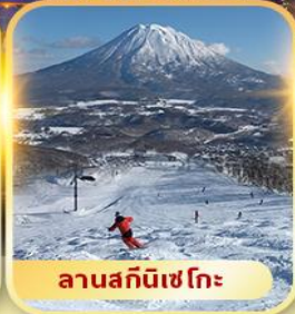
ลานสกีนิเซโกะ