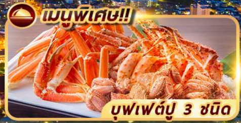
เมนูพิเศษ!!