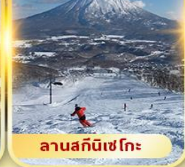
ลานสกีนิเซโกะ