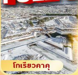
โทริยิวคาคุ