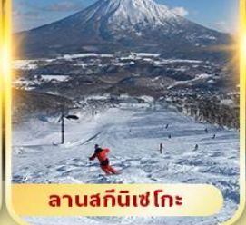
ลานสกีนิเซโกะ