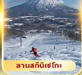
ลานสกีนิเซโกะ