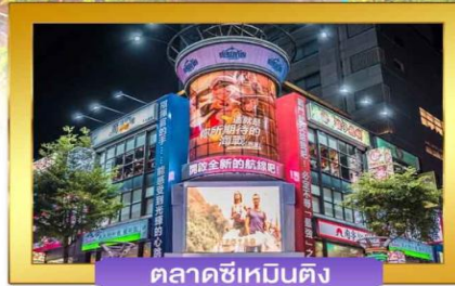
ตลาดซีเหมินติง