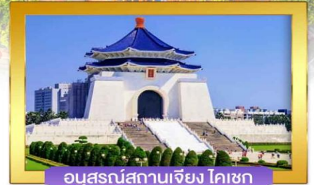
อนุสรณ์สถานเจียง ไคเชก