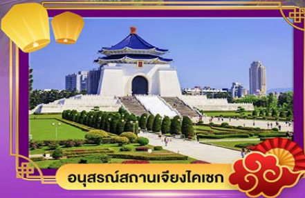
อนุสรณ์สถานเจียงไคเชก