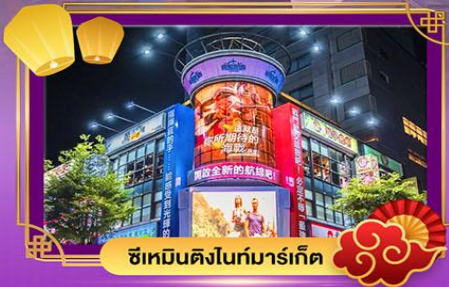
ช้อปปิ้งในห้างทันสมัย