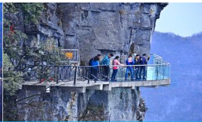
หน้าพลาวยฟ้าทางเดินกระจก