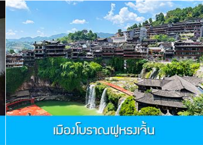
เมืองโบราณฝูหยงเก๋น