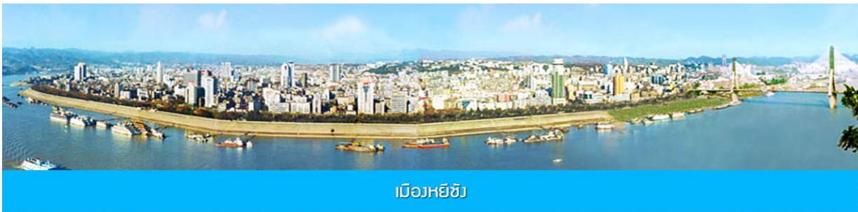
เมืองหยี่ซัง

- ไปรุ่งใส่น้ำเชื้อถือ ไม่มีค่าใช้จ่ายซ่อนเร้น ขายออฟชั่น 1. จุดชมวิวยุทธยานอวกาศ, และ ชม ชมลิฟท์แก้วไปหลง 2. โชว์จิ้งจอกขาว โปรอ่านรายละเอียดในโปรแกรม