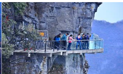
หน้าพาลอยฟ้าทางเดินกระจก