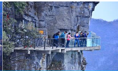
หน้าพาลอยฟ้าทางเดินกระจก