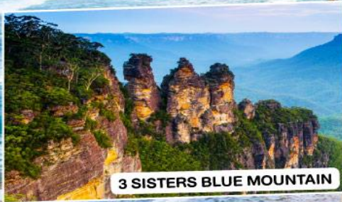
3 SISTERS BLUE MOUNTAIN