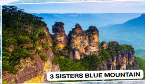
3 SISTERS BLUE MOUNTAIN