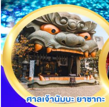
ศาลเจ้านิมบะ ยาชากะ

งานเทศกาลประดับไฟซากามิโกะ อิลลูมินเนชั่น พักออนเซ็น 1 คืน พักโฮซาก้า 2 คืน