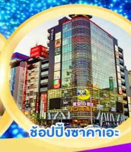
ช้อปปิ้งซากาคาเอะ