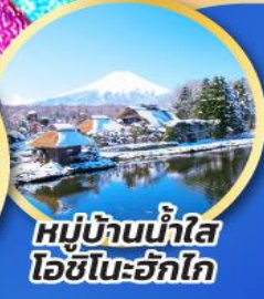
หมู่บ้านน้ำใส โอชิโนะอิกิโกะ