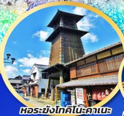
หอรบขังโตคิโนะคาเนะ