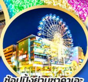
ช้อปปิ้งย่านซากาเอะ