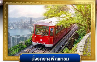
นั่งรถรางพิกแนม