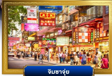
จิมซาจุ่ย