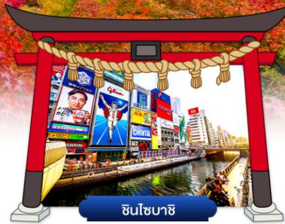
ชินโซบาชิ