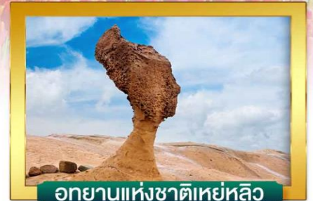
อุทยานแห่งชาติเหยหลิว