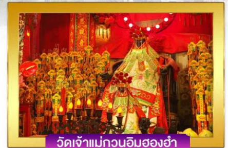
วัดเจ้าแม่กวนอิมสองฮา