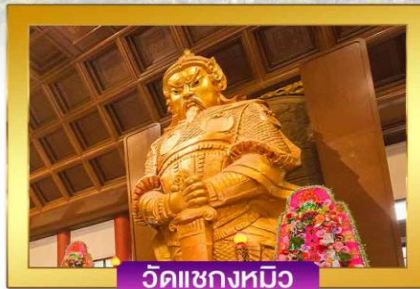
วัดแซงกงหมิว