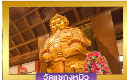
วัดแซงกหวี