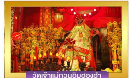
วัดเจ้าแม่กวนอิมสองฮา