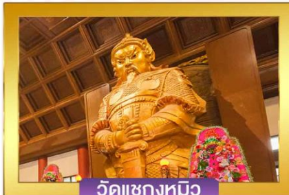
วัดแซงกหมิว