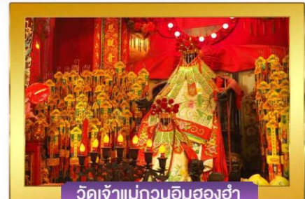
วัดเจ้าแม่กวนอิมสองอ่า