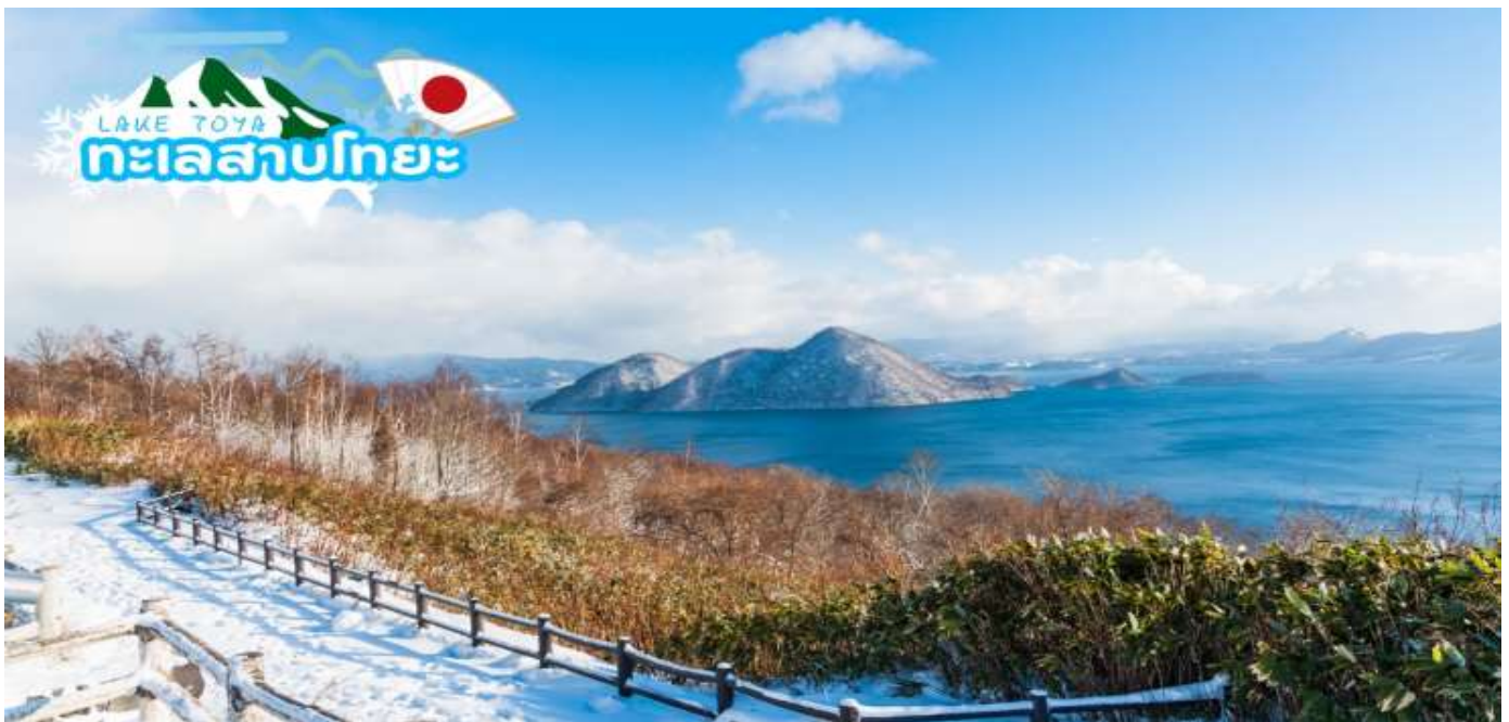
GO2CTS-TG031--HOKKAIDO HAKADATE SKI WINTER 6D4N BY TG

นำท่านชม หุบเขานรกจิโกกุดานิ (Jigokudani) หรือเรียกอีกอย่างว่า “หุบเขานรก” อยู่ในเขตอุทยานแห่งชาติ Shikotsu-Toya เมือง Noboribetsu ที่เรียกว่าหุบเขานรกนั้น เพราะที่นี่มีทั้งบ่อโคลนและบ่อน้ำร้อนที่เดือดตามธรรมชาติกระจายไปทั่วบริเวณที่มีควันร้อน ๆ พวยพุ่งขึ้นมาอยู่ตลอดเวลา และถือเป็นแหล่งกำเนิดน้ำแร่และออนเซ็นที่มีชื่อเสียงที่สุดบนเกาะฮอกไกโด ทางเข้าหุบเขาจะมีสัญลักษณ์เป็นยักษ์สีแดงตัวใหญ่ถือตะบองคอยต้อนรับเป็นยักษ์ที่คอยคุ้มกันภัยให้ผู้มาเยือนดังนั้นทุกบริเวณพื้นที่ของที่นี่ไม่ว่าจะเป็นร้านขายของที่ระลึกห้องน้ำจะมีป้ายต่าง ๆ ที่มีสัญลักษณ์รูปยักษ์ให้เห็นโดดเด่นเป็นเอกลักษณ์