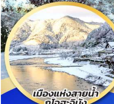
เมืองแห่งสายน้ำ กุโจะจิมัง