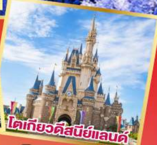
โตเกียวดิสนีย์แลนด์

อิสระท่องเที่ยว 1 วันเต็มในโตเกียว หรือซื้อทัวร์เสริม Tokyo Disneyland