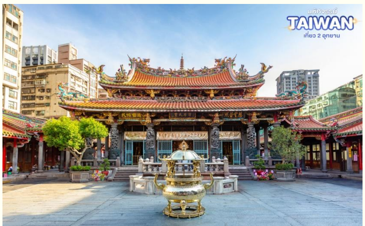
TAIWAN เที่ยว 2 อุทยาน

เป็นหนึ่งในวัดที่เก่าแก่และมีชื่อเสียงมากที่สุดแห่งหนึ่งของเมืองไทเป เพื่อเป็นสถานที่สักการะบูชาสิ่งศักดิ์สิทธิ์ตามความเชื่อของชาวจีน ที่เชื่อกันว่าเป็นเทพผู้ผูกด้ายแดงให้สมหวังด้านความรัก จนบางคนเรียกกันว่าเป็นวัดสไตล์ไต้หวัน ทำให้ที่นี่เป็นอีกหนึ่งแหล่งท่องเที่ยวไม่ควรพลาดของเมือง