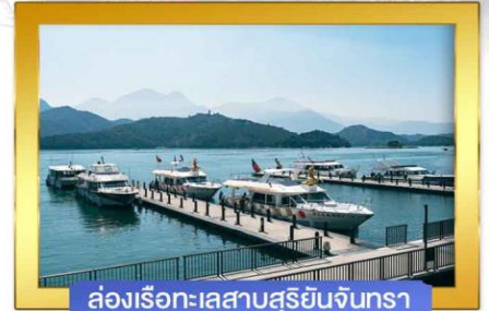
ล่องเรือทะเลสาบสุริยันจันทรา