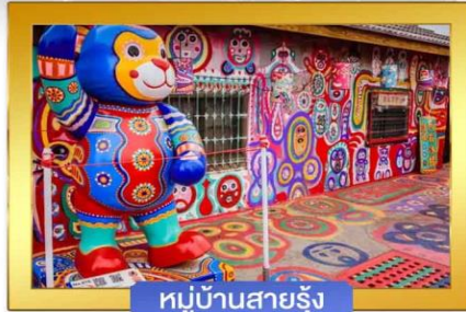
หมู่บ้านสายรุ้ง