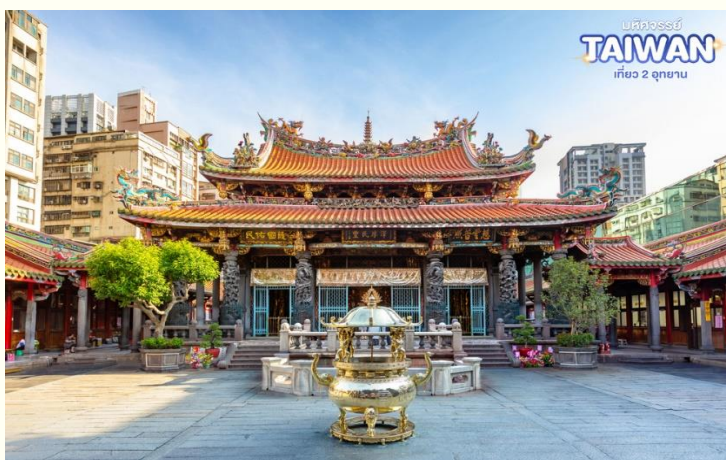
เขตท่องเที่ยว TAIWAN เกือบ 2 ฤดูหนาว

เป็นหนึ่งในวัดที่เก่าแก่และมีชื่อเสียงมากที่สุดแห่งหนึ่งของเมืองไทเป เพื่อเป็นสถานที่สักการบูชาสิ่งศักดิ์สิทธิ์ตามความเชื่อของชาวจีน ที่เชื่อกันว่าเป็นเทพผู้ผูกด้ายแดงให้สมหวังด้านความรัก จนบางคนเรียกกันว่าเป็นวัดสไตล์ไต้หวัน ทำให้ที่นี่เป็นอีกหนึ่งแหล่งท่องเที่ยวไม่ควรพลาดของเมือง