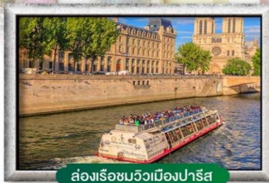
ส่องเรือชมวิวเมืองปารีส