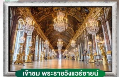
เข้าชม พระราชวังแวร์ซายน์