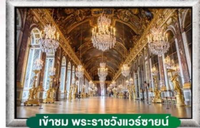
เข้าชม พระราชวังแวร์ซายน์