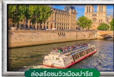
ล่องเรือชมวิวเมืองปารีส