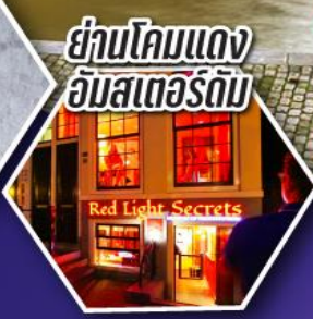
ย่านโคมแดง อัมสเตอร์ดัม

ตะลุยอัมสเตอร์ดัม ทั้งจัตุรัสดามสแควร์ และย่านโคมแดง (Red Light)