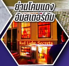
ย่านโคมแดง อัมสเตอร์ดัม

ตะลุยอัมสเตอร์ดัม ทั้งจัตุรัสดามสแควร์ และย่านโคมแดง (Red Light)