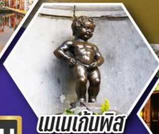
แมมเกินฟิส