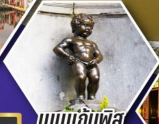
แมมเกินฟิส