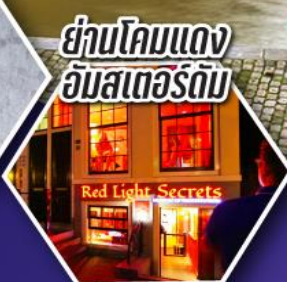
ย่านโคมแดง อัมสเตอร์ดัม

ตะลุยอัมสเตอร์ดัม ทั้งจัตุรัสดามสแควร์ และย่านโคมแดง (Red Light)