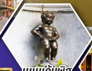
แมมเกินฟิส