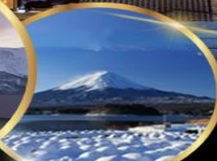
สวน โออิชิ พาร์ค