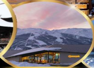
Snow peak land hakuba