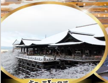
วัด คิโยมิสึ