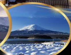
สวน โออิชิ พาร์ค