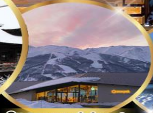
Snow peak land hukuba