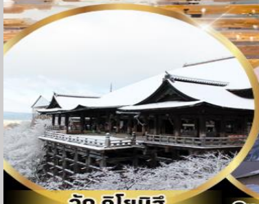
วัด คิโยมิจิ