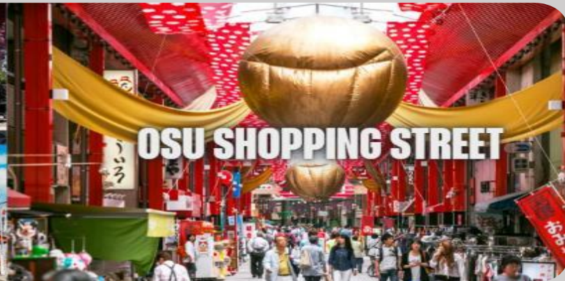
OSU SHOPPING STREET