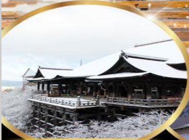
วัด คิโยมิสึ