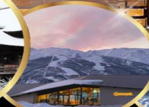
Snow peak land hukuba