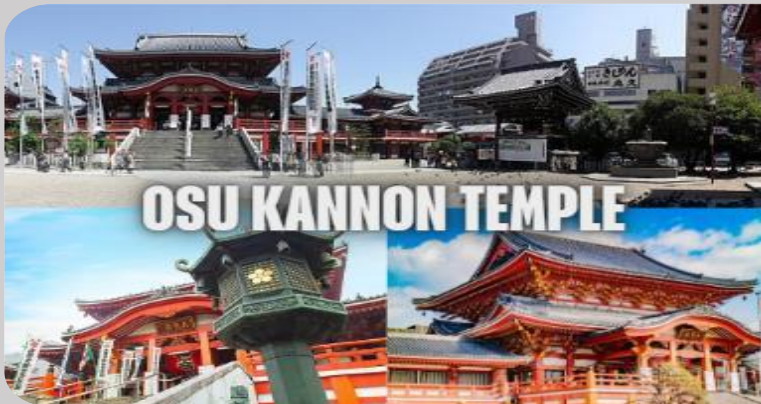
OSU KANNON TEMPLE

จากนั้นนำท่านเดินทางสู่ วัดโอสึ คันนง (Osu Kannon Temple) เป็นวัดพุทธที่อยู่ใจกลางเมืองและมีชื่อเสียงโด่งดังของเมืองนาโกย่า ภายในอาคารหลักของวัดเป็นที่ประดิษฐานพระพุทธรูปไม้แกะสลักเก่าแก่ที่ขึ้นชื่อเรื่องความเมตตา ซึ่งชาวเมืองให้ความเคารพนับถือเป็นอย่างยิ่ง นอกจากนี้สถาปัตยกรรมสิ่งปลูกสร้างตัวอาคารของวัดยังทาสีแดงสดดูโดดเด่น และสวยงามเป็นอย่างยิ่ง บริเวณด้านหลังวัดยังมี ย่านการค้าโอสึ (Osu Shopping Arcade) แหล่งช้อปปิ้งชื่อดังอีกแห่งหนึ่งของเมืองนาโกย่า ที่ซึ่งรวบรวมร้านค้าต่าง ๆ มากมายกว่า 1,200 ร้าน มีสินค้าต่าง ๆ มากมายให้ท่านเลือกซื้อเป็นของขวัญของฝาก ตลอดจนร้านอาหาร คาเฟ่น่ารักสไตล์ญี่ปุ่น ให้ท่านเลือกเช็กอินถ่ายรูปได้อย่างเพลิดเพลิน