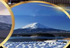
สวน โออิชิ พาร์ค